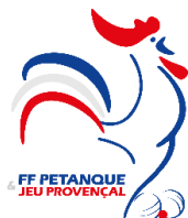
(Logo de l'association)

L'importance des associations et des fondations dans la vie de la Nation et leur contribution à l'intérêt général justifient que les autorités administratives décident de leur apporter un soutien financier ou matériel. Il en va de même pour les fédérations sportives et les ligues professionnelles. L'administration, qui doit elle-même rendre des comptes aux citoyens, justifier du bon usage des deniers publics et de la reconnaissance qu'elle peut attribuer, est fondée à s'assurer que les organismes bénéficiaires de subventions publiques ou d'un agrément respectent le pacte républicain.